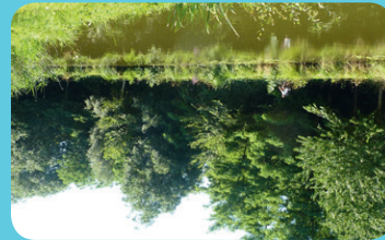
▶ L'étang des Noës -----