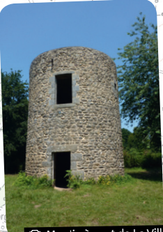
© Moulin à vent de La Ville Gouin