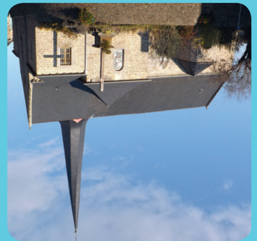
▶ L'église et son clocher Tors (XII e siècle - 1993) -----

« tors ». Observez le sommet du clocher. Il semble légèrement vers la droite. Mais non, il est véritablement tordu d'un huitième de tour et fait partie de la cinquantaine de clochers tors répertoriés à ce jour en Europe et le seul en Bretagne. Leur origine, très controversée, fait l'objet de nombreuses légendes de son hypothèse : le marin y voit l'œuvre d'un charpentier de marine qui se serait exercé à le faire tanguer ; le poète y lit la volonté d'offrir au vent toutes les faces de la flèche ; au menuisier affirme que le bois, trop vert lors de la construction, aurait été déformé avec le temps ; le sourcier y perçoit les méandres des d'un clocher possédant une courbe charpente vilaine, dit clocher Saint-Pierre. Elle date du XII e ou du XIII e siècle et fut remaniée au XIV e siècle. La tour du clocher fut érigée au XVII e siècle. Elle est surmontée d'un clocher possédant une courbe charpente vilaine, dit clocher