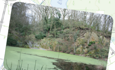
© Anciennes carrières de La Bouderie