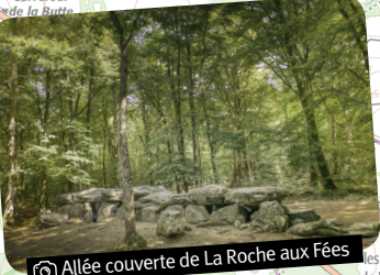
Alée couverte de La Roche aux Fées