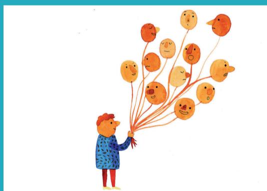
Illustration de Marion Barraud

Marion Barraud est une illustratrice et auteure de bande dessinée nantaise qui nous régale avec ses dessins naïfs et poétiques. Aquarelle, feutres, collage, gif, coloriages, Marion manie différentes techniques en gardant un style bien à elle.