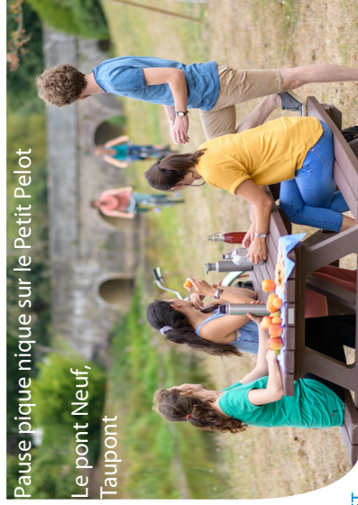
Pause pique-nique sur le Petit Pelot