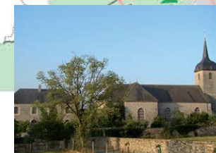
Belle unité architecturale du bourg de Thourie.