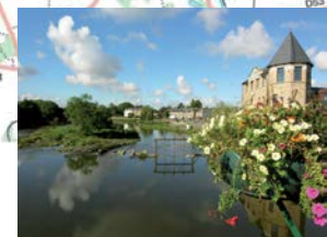
Le moulin sur la Vilaine entre Messac et Guipry.