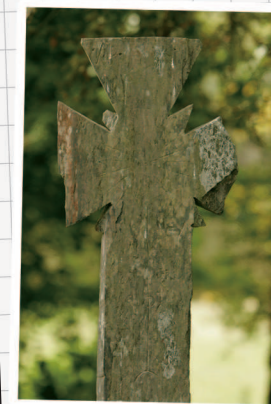
Croix près de la chapelle Saint-Méen