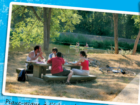
Pique-nique à l'écluse de La Potinais