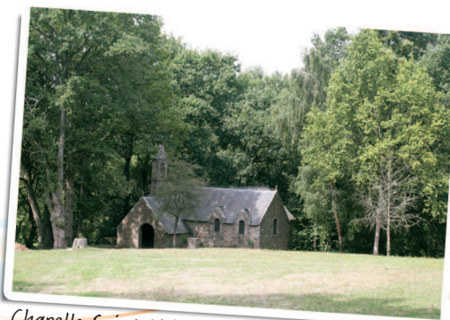
Chapelle Saint Méen

Cette chapelle est un des derniers vestiges de l'ancienne abbaye de Busal. En ruine depuis le début du 20 e siècle, elle a été rénovée dans les années 60 par un groupe de passionnés. Un pardon s'y tient le dernier week-end de juin.