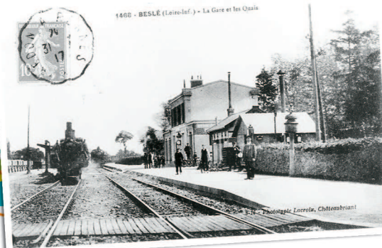
Gare de Beslé-sur-Vilaine

L'arrivée de la ligne de chemin de fer vers 1861 marque un tournant important pour Beslé-sur-Vilaine et pour le Pays de Redon en général. Le commerce se développe considérablement. L'agriculture occupe le premier rang aussi bien pour les exportations que pour les importations. Depuis Beslé-sur-Vilaine, partent des boeufs gras pour Poissy, des pommes et du bois. Le transport des passagers progresse. Trois classes existent alors variant selon le confort des wagons. En 1869, le prix d'un aller retour Redon – Beslé sur Vilaine était de 2,15 francs en 1ère classe et de 1,15 francs en 3ème classe. La gare de Beslé sur Vilaine reste très active jusqu'en 1950 et est encore utilisée de nos jours.