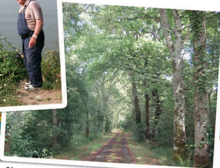
Chemin en sous-bois