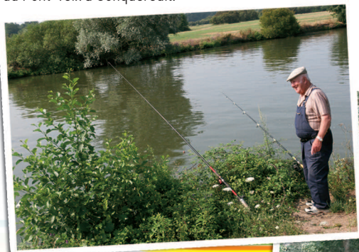
Pêcheur au bord de la Vilaine

Pour voir un bel exemple de voie romaine dallée, rendez-vous au château du Pont-Veix à Conquereuil.