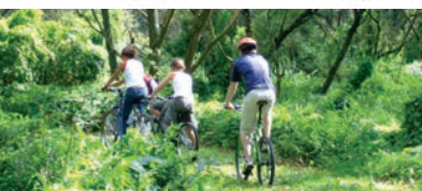
Promenade Jules Revert

1 Longer la cathédrale puis emprunter à droite la promenade Jules Revert le long des anciens remparts. Belle vue sur les marais et le Mont-Dol.