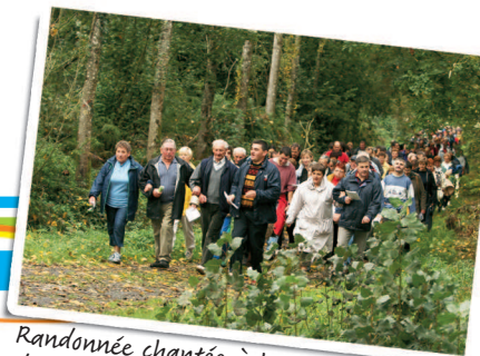
Randonnée chantée à la Fête des fruits d'automne