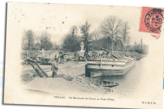
PEILLAC - Un Marchand de Chaux au Port d'Oust

L'Oust était déjà canalisé avant la construction du canal de Nantes à Brest grâce à des écluses à deux portes. L'Oust, la Vilaine et l'Isac étaient les seules voies de pénétration de la Bretagne devenant ainsi des points faibles en cas d'invasion par mer. Ses voies étaient utilisées à des fins militaires comme économiques.