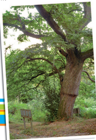
Sentier des châtaigniers