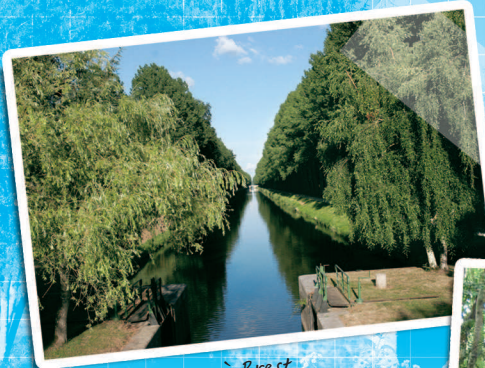
Canal de Nantes à Brest