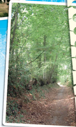
Chemin en sous-bois