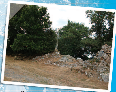
Oratoire du Pas du Saint