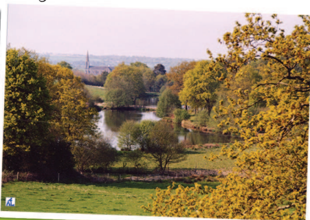
Chemin en sous-bois