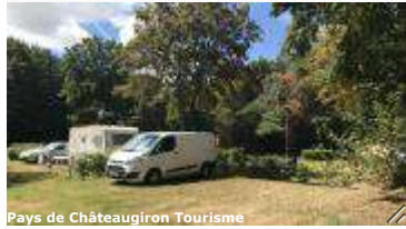
Pays de Châteaugiron Tourisme