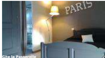
Gîte la Passerelle