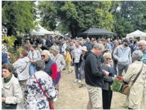
Belle affluence pour la neuvième édition des Floréales.

Le public a semblé ravi par la diversité des exposants et l'imposante variété de plantes,