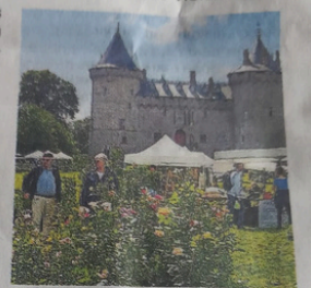
La 9 e édition des Floréales, dans le parc du château.

« Avant les outils étaient faits par le maréchal-ferrant du village, rappelle l'ancien ferronnier. C'est un métier