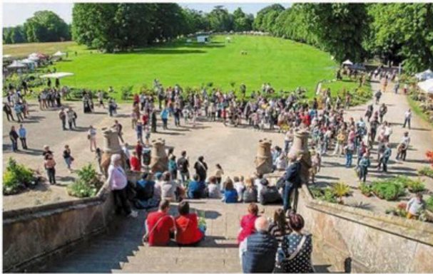
Les Floréales ont lieu dans le parc du château.

donneront un récital à 10 h 30, la fanfare de l'école de musique du SIM déambulera à 16 h. Et à 17 h, le groupe Watercats introduira le fest-noz», poursuit Philippe Bouvier.