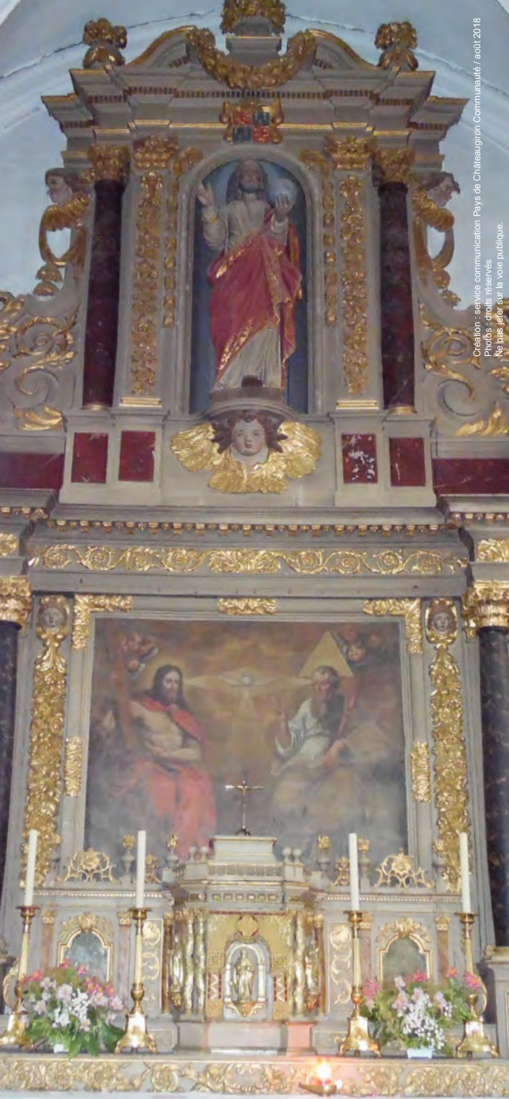
Creation : service communication Pays de Châteaugiron Communauté / août 2018 Ne pas jeter sur la voie publique.