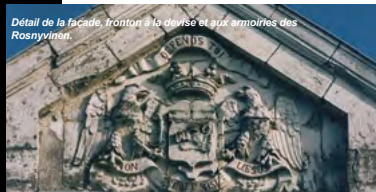
Détail de la façade, triton à la devise et aux armoiries des Rosnyvinen.

des fêtes à partir de 1954. > Continuez sur la rue du Temple, jusqu'au croisement de la rue Neuve.