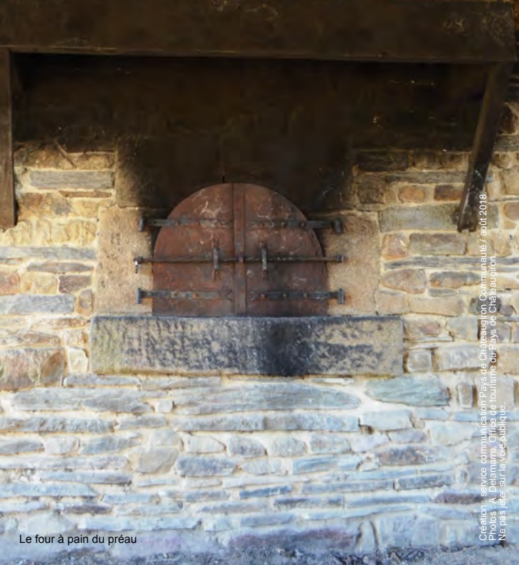
Le four à pain du préau

Création : service communication Pays de Châteaugiron Communauté / août 2018. Photos : A. Delmaire. Office de tourisme du Pays de Châteaugiron. Ne pas jeter sur la voie publique.