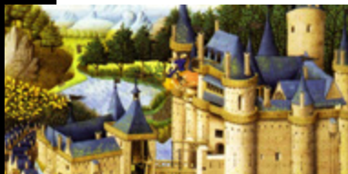
Créat. : Bibliothèque Nationale de France

Fait exceptionnel : Châteaugiron a été représenté dans une célèbre enluminure issue d'un manuscrit du XV e siècle conservé à la Bibliothèque Nationale de France !