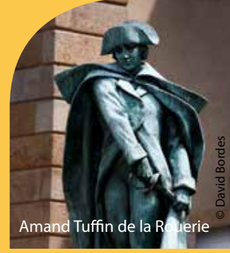
Amand Tuffin de la Rouërie