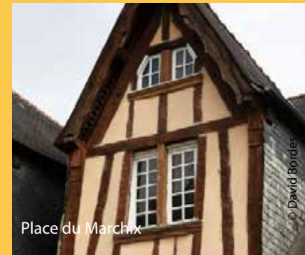
Place du Marchix