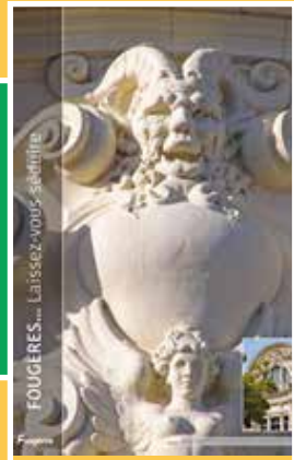
FOUGÈRES... Laissez-vous séduire

À DÉCOUVRIR ! CIRCUIT PHOTOS Découvrez également dans le jardin du Val Nançon, au fil de votre balade, un parcours photos vous dévoilant les merveilles patrimoniales de la haute ville et les sites incontournables à visiter.