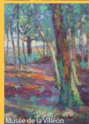
Musée de la Villéon