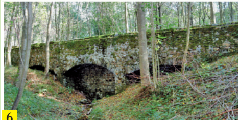
Aqueduc d'amenee des eaux captées en forêt