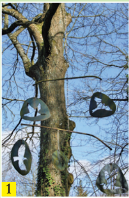
Sculptures sur le site de l'étang des Cotterêts