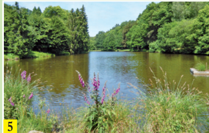
Etang des Cotterêts