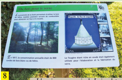
L'ancienne verrerie de Laignelet