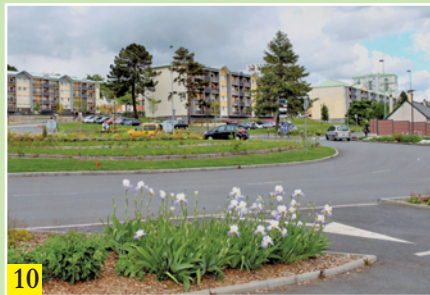
Le quartier des Cotterêts après sa réhabilitation de 2014-2016