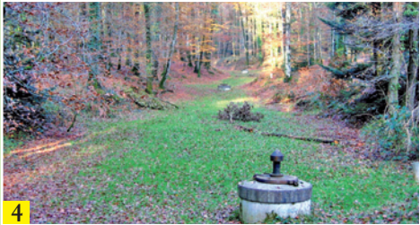
Têtes de captages