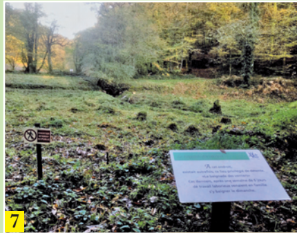
Piscine des verriers