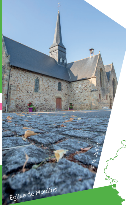
Église de Moulins