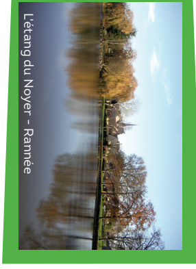
L'étang du Noyer - Rannée