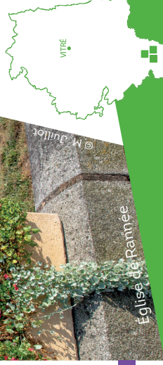
Église de Rannée