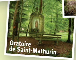
Oratoire de Saint-Mathurin