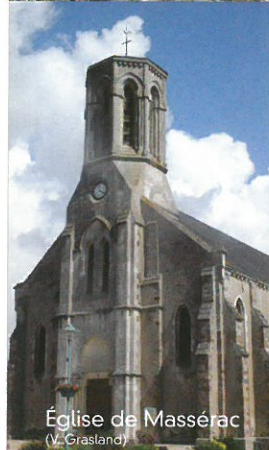
Église de Massérac (V. Grasland)