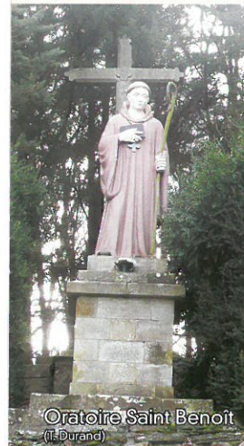
Oratoire Saint Benoît (F. Durand)

Maison du Tourisme du Pays de Redon 02 99 71 06 04