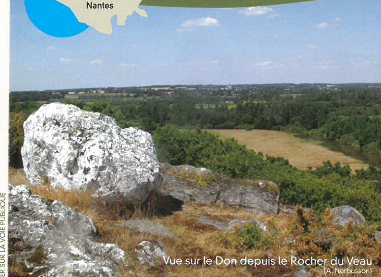
Vue sur le Don depuis le Rocher du Veau (A. Nerbusson)