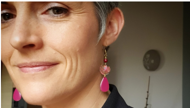
8 Rue du Bocage Pleumeleuc