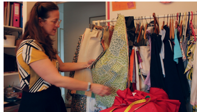
8 Rue des Grandes Grées Montfort-sur-Meu