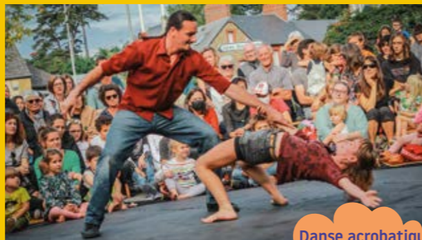
Danse acrobatique de l'instant

Mercredi 10/06 - de 17h à 19h - Lieu (voir site internet) Atelier parent/enfant de portés acrobatiques | à partir de 6 ans | gratuit | Inscription obligatoire : resa.cajd@fougères-agglo.bzh