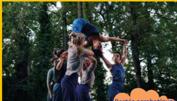
Portés acrobatiques en collectif