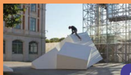
Cirque en relief