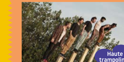
Haute voltige sur trampoline & bastaings