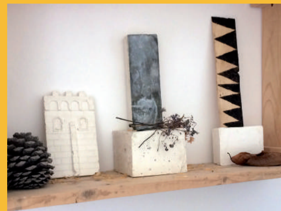
Corentine Le Pivert et Nicolas Gerot, Odiées, installation, 2018

Résidence du 12 novembre au 11 janvier 2019 EXPOSITION DU 11 JANVIER AU 1 er MARS 2019