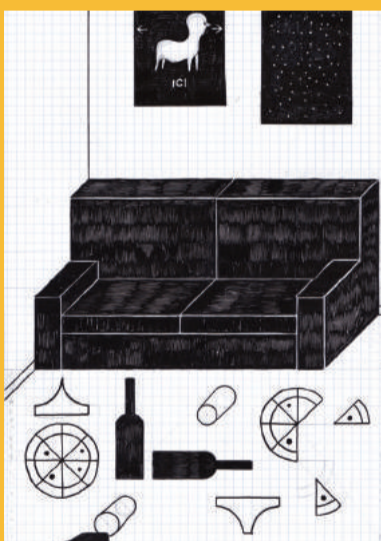
Olivier Garraud, L'Office du dessin numéro 30, posca, 21 x 29,7 cm, 2016

Résidence du 4 février au 15 mars 2019 EXPOSITION DU 15 MARS AU 26 AVRIL 2019 Vernissage LE VENDREDI 15 MARS À 18H30