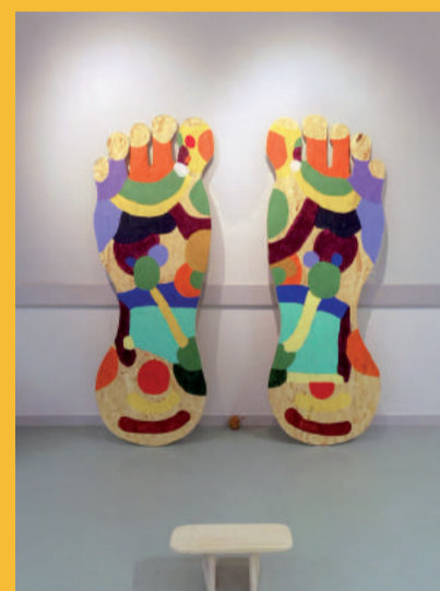
Anaïs Touchot, vue de l'exposition Karma à la galerie de la cité scolaire de Iroise, Brest, 2018

Résidence du 27 mai au 5 juillet 2019 EXPOSITION DU 5 JUILLET AU 25 AOÛT 2019 Vernissage LE VENDREDI 5 JUILLET À 18H30