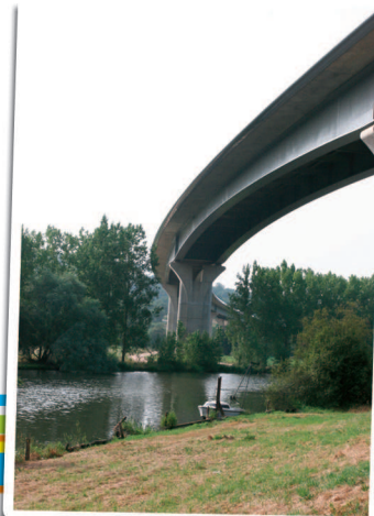
Viaduc de Saint-Nicolas-de-Redon

Une pierre nommée la Roche Cado ou Pierre de Gargantua, située près du village de Cado, évoque une des légendes de Gargantua, nombreuses dans le Pays de Redon. On raconte que ce dernier s'arrêta pour boire l'eau de la Vilaine, un pied posé sur chaque rive. Gêné par un caillou dans sa chaussure, il la secoua et le caillou tomba à l'emplacement de la roche, d'où son surnom.