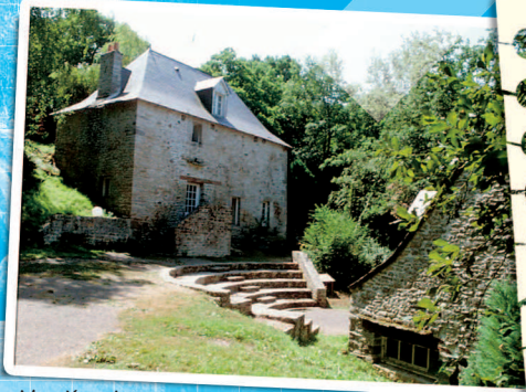
Moulin de Quip