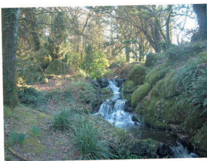
Cascade au moulin de Quip