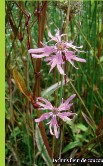
Lychnis fleur de coucou