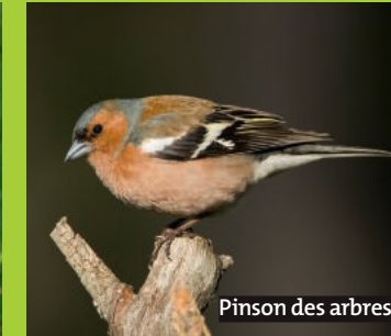
Pinson des arbres