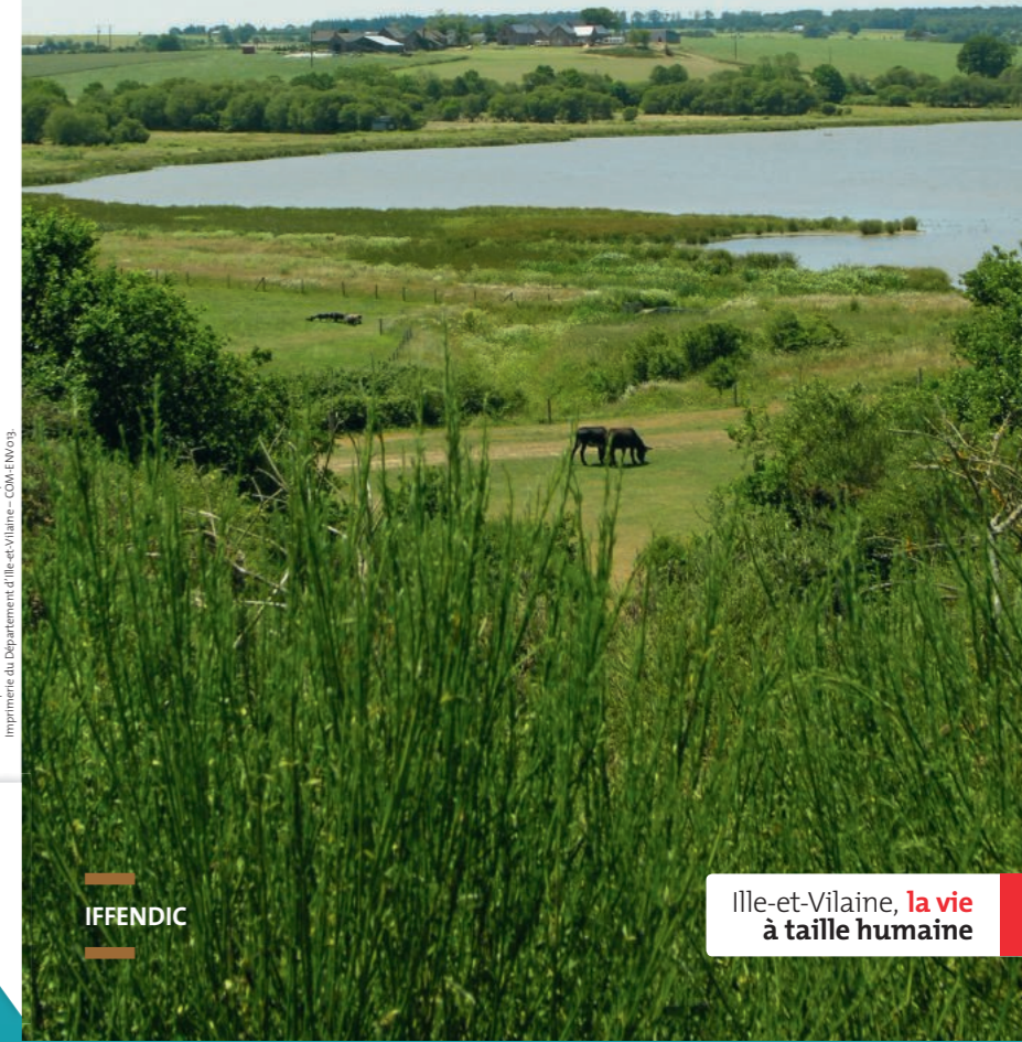
Avril 2018 - D-PDF-ca48-008 Imprimerie du Département d'Ille-et-Vilaine - COM-EN-003

Ille-et-Vilaine, la vie à taille humaine