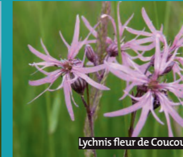
Lychnis fleur de Coucou