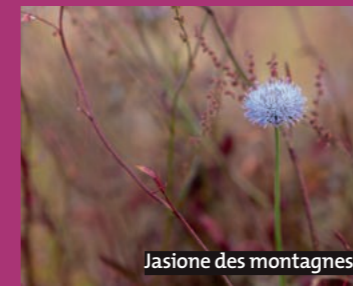
Jasione des montagnes