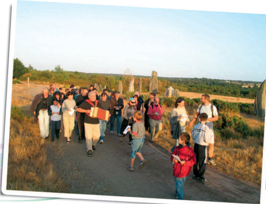
Animation sur les landes de Cojoux

L'or des ajoncs, le mauve de la bruyère cendrée et le blanc des hélianthèmes en ombelle (fleur blanche à cinq pétales) : le décor est planté. Les landes de Cojoux sont des landes dites « sèches », poussant sur un sol constitué de schiste rouge. Ce site préservé fait partie des espaces naturels départementaux depuis 1989. Au cours de votre promenade, vous apercevrez sans doute les chevaux « Mulassier du Poitou », un cheval de trait robuste et des vaches écossaises « les Highland Cattle » à la robe rousse et aux longs poils. Leur pâturage assure ainsi l'entretien du site.