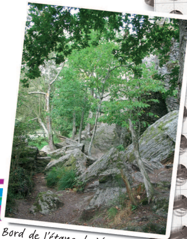
Bord de l'étang du Val

Lacez bien vos chaussures et préparez-vous à l'assaut de ce chemin abrupt. Si, si, on est fatigué après ce petit passage. Court mais intense !