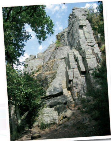
Site d'escalade à l'étang du Val

Variante possible : Au point 3, prendre à droite le chemin rejoignant le plateau de La Lande de Cojoux pour rejoindre plus rapidement le point de départ.